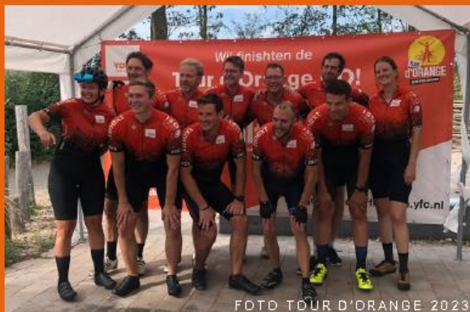
FOTD TOUR D'ORANGE 2023